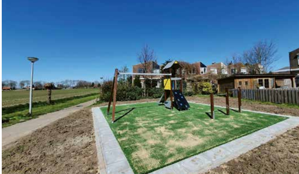
De speel-, glij- en klimtoren die Hercules Speeltoestellen in de Griegstraat in Numansdorp in de gemeente Hoeksche Waard heeft aangelegd

Samen met de bewoners – ouders én kinderen – koos de gemeente uiteindelijk voor een evenwichtsparcours (WD1461) op de locatie Bachstraat en een combinatietoestel met klimtoren op de locatie Griegstraat. 'Evenwichtsparcoursen worden almaar populairder', vertelt Bakker. En dat is mooi. 'De kinderen spelen veel minder buiten dan vroeger. Ze bewegen veel minder en zijn motorisch ook